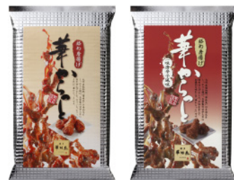
▲華からっとはライン生産ではなく、揚げから仕上げまでほぼ手作り！ ▲左／華からっと(プレーン) 右／華からっと(一味唐辛子風味)